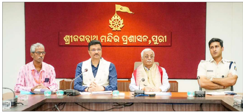
ମିଳିବା' ଅର୍ଥାତ୍ ସବୁକିଛି ସଠିକ୍ ଥିବା ପ୍ରମାଣିତ ହେବା ପରେ, ସୋସିଆଲ ମିଡିଆରେ ବିଜେପିକୁ ଅନେକ ପ୍ରଶ୍ନର ସମ୍ମୁଖୀନ ହେବାକୁ ପଡୁଛି । ନେତୈଜ୍ଞମାନେ ସିଧାସଳଖ

ରତ୍ନଭଣ୍ଡାରର ପବିତ୍ରତା ଅକ୍ଷୁର୍ଣ୍ଣ ରହିଥିବା ଜାଣିବା ଭଲଭଲ ପାଇଁ ଯେତିକି ଆଶ୍ୱସ୍ତିର ବିଷୟ, ଏହାକୁ ନେଇ ହୋଇଥିବା ପୂର୍ବତନ ରାଜନୈତିକ ବୟାନବାଜି ଏବେ ସରକାରଙ୍କ ବିଶ୍ୱସନୀୟତା ଉପରେ ପ୍ରଶ୍ନବାଚୀ ସୃଷ୍ଟି କରିଛି । ଆଗାମୀ ଦିନରେ ବିଜେପି ଏହାର ମୁକାବିଲା କିପରି କରୁଛି, ତାହା ହିଁ ଦେଖିବାକୁ ବାକି ରହିଲା ।