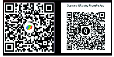
ଆପଣଙ୍କ ମତାମତ ଓ ସହଯୋଗ ଅପେକ୍ଷାରେ